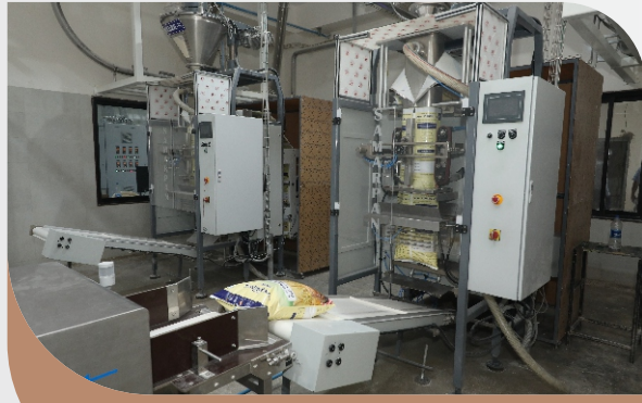
ખેડૂતોના સર્વાંગી વિકાસ માટેનું સીમાચિહ્ન બનાસ આટા પ્લાન્ટ