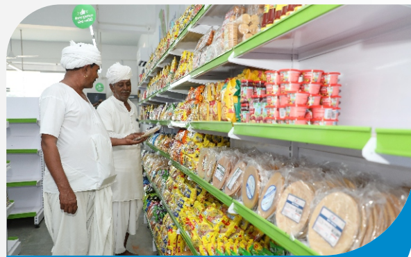
ઉમંગ મોલ સ્થાનિક ઉત્પાદનો સાથે વ્યાજબી અને શ્રેષ્ઠ ખરીદી

બનાસ ડેરીએ એક હકારાત્મક અભિગમ સાથે ઉમંગ મોલ શરૂ કર્યા છે, જેનો ઉદ્દેશ પશુપાલકો, ખેડૂતો, અને ગ્રામ્ય વિસ્તારના લોકોની જીવન જરૂરી ચીજવસ્તુઓ અને સામગ્રીને વ્યાજબી ભાવે તેમના ઘર આંગણે ઉપલબ્ધ કરાવવાનો છે. આ મોલમાં, બનાસકાંઠા જિલ્લાના સ્થાનિક ઉત્પાદનથી બનેલી વસ્તુઓને બનાસ ડેરીના નામ સાથે પેકિંગ કરીને વેચવામાં આવે છે. અત્યાર સુધી, બનાસ ડેરીએ બનાસકાંઠા જિલ્લાના વિવિધ ગામોમાં ૪૦ થી વધુ ઉમંગ મોલ શરૂ કર્યા છે. આ મોલ આધુનિક મોલ જેવા જ છે, જ્યાં શ્રેષ્ઠ ગુણવત્તા અને વ્યાજબી ભાવે ચીજવસ્તુઓ ઉપલબ્ધ છે, તેમજ ગ્રાહકો માટે ડિસ્કાઉન્ટ અને ડિજિટલ પેમેન્ટની સુવિધા પણ ઉપલબ્ધ છે. આ મોલને રૂરલ મોલ તરીકે ઓળખી શકાય છે, જે દૂધ મંડળીઓ સાથે જોડાયેલા છે અને તેના દ્વારા પશુપાલકોને લાભ થાય છે. આ રીતે, બનાસ ડેરી ગ્રામિણ વિસ્તારોમાં આધુનિક અને વ્યાજબી ખરીદીની સુવિધાઓ પ્રદાન કરીને, લોકોની સુખાકારીમાં વધારાનો પ્રયત્ન કરી રહી છે. આગળના સમયમાં, બનાસ ડેરી અન્ય ગામડાઓમાં પણ આ ઉમંગ મોલ સ્થાપિત કરવાની યોજના ધરાવે છે.