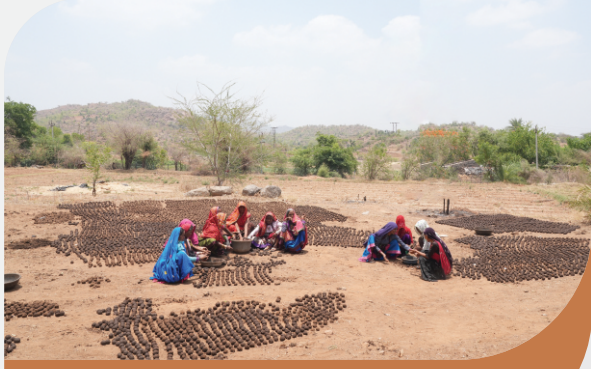
સીડ બોલ મહાઅભિયાન ૧ કરોડ સીડ બોલથી બનાસને હરિયાળો બનાવવાનો સંકલ્પ