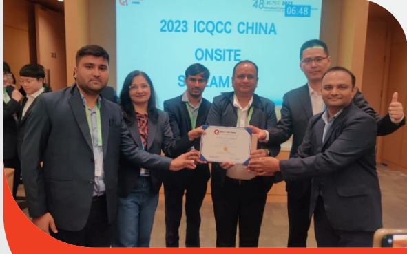
વિદેશના પ્લેટફોર્મ પર સુવર્ણ પુરસ્કાર મેળવ્યો

ચીન ખાતે આયોજિત ૪૮મા આંતરરાષ્ટ્રીય ક્વોલિટી કંટ્રોલ સર્કલ (ICQCC) પ્રોગ્રામમાં બનાસ ડેરીએ સુવર્ણ પુરસ્કાર જીતીને બનાસકાંઠાનું નામ અને ગૌરવ દેશભરમાં વધાર્યું છે. અપેક્ષિત વિજેતા થવા માટે, બનાસ ડેરીએ થોડા મહિના પહેલા વડોદરા ખાતે OCFI (ક્વોલિટી સર્કલ ફોરમ ઓફ ઈન્ડિયા) દ્વારા આયોજિત એચીવિંગ ક્વોલિટી સોલ્યુશન ફોર એક્સલન્સ થીમ અંતર્ગત કાર્યક્રમ, ૭ મુદ્દા, TOM અને T PM કન્વેન્શનમાં ભાગ લીધો હતો. આ કન્વેન્શન દરમિયાન, બનાસ ડેરીની ૧૨ ટીમોમાંથી ૧૩ ટીમોએ સુવર્ણ પુરસ્કાર પ્રાપ્ત કર્યો અને ૧ ટીમ (એલ.એમ.પી. ૨ એન્ડ ૩)એ એક્સલન્સ એવોર્ડ જીત્યો. આ વિજેતા ટીમો આંતરરાષ્ટ્રીય સ્તરે યોજાતા ICQCC કન્વેન્શન માટે પસંદ થઈ હતી. બનાસ ડેરીએ ચીનમાં આયોજિત પ્રોગ્રામમાં ભાગ લઈને સુવર્ણ પુરસ્કાર જીત્યો છે, જે તેની અગ્રણી કાર્યક્ષમતાનો અને સતત શ્રેષ્ઠતાનો સંકેત છે.