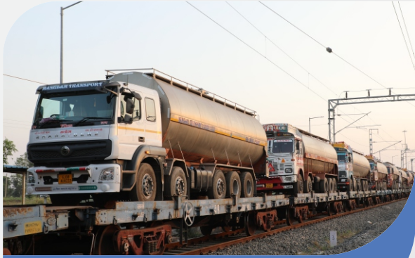
ગુજરાત બહાર સમયસર દૂધ પહોંચાડવા માટે અનોખી પહેલ 'ટ્રક ઓન ટ્રેન'

વિશ્વસનીય વડાપ્રધાનશ્રી નરેન્દ્રભાઈ મોદીજીએ પોતાની 'મન કી બાત' કાર્યક્રમમાં દેશના વિવિધ ક્ષેત્રોમાં થયેલા યથાર્થ કાર્યોના ઉલ્લેખ સાથે, ઓગષ્ટ મહિનાના છેલ્લા અઠવાડિયામાં બનાસ ડેરીની પ્રશંસા કરી હતી. તેમણે 'ટ્રક ઓન ટ્રેન' પ્રોજેક્ટ અંગે વાત કરી હતી, જેનાથી બનાસ ડેરીમાં દરરોજ આશરે ૭૫ લાખ લીટર દૂધની પરિવહન પ્રક્રિયાની ગુણવત્તામાં સુધારો આવ્યો છે. વડાપ્રધાનશ્રી એ જણાવ્યું કે આ નવીન પ્રોજેક્ટના અમલથી, દૂધને અન્ય રાજ્યોમાં પહોંચાડવા માટેનો સમય ઘટાડી શકાય છે, અને લોડીંગ- અનલોડીંગની મર્યાદાઓને પાર કરીને દૂધની ગુણવત્તા પણ જાળવી શકાય છે. 'ટ્રક ઓન ટ્રેન' પ્રોજેક્ટનો લાભ લઈને, બનાસ ડેરી દરરોજ આશરે ૬ લાખ લીટર દૂધ અન્ય રાજ્યોમાં સફળતાપૂર્વક મોકલી રહી છે, જેનાથી દૂધના પરિવહન સમયમાં નોંધપાત્ર ઘટાડો થયો છે.