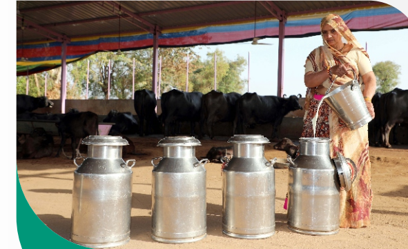
દૈનિક સર્વાધિક ૧ કરોડ લીટરનું દૂધ સંપાદન છતાં એક પણ "મિલ્ક હોલીડે" નહિ

બનાસ ડેરીએ છેલ્લા ૮ વર્ષમાં દૂધના વ્યવસાયમાં અદભૂત પ્રગતિ હાંસલ કરી છે, જે વ્યવસ્થાપન અને કાર્યક્ષમ વ્યવસ્થાઓના કારણે શક્ય બની છે. 'મિલ્ક હોલીડે' નો ઉપયોગ ન કરીને, પશુપાલકોને દૂધની આવકમાં નુકસાન ન થાય તે સુનિશ્ચિત કરવામાં આવ્યું. આ રીતે, સતત દૂધના સંપાદનની પ્રક્રિયા ચાલુ રાખવામાં આવી, જેના પરિણામે ચાલુ વર્ષે દૈનિક ૧ કરોડ લિટરથી વધુ દૂધનો જથ્થો આવવા લાગ્યો. નિયામક મંડળની કુશળતા અને વહીવટી કુશળતાના પરિણામે, બનાસ ડેરી આ વિશાળ દૂધના જથ્થાને સફળતાપૂર્વક વહન કરે છે અને પશુપાલકોને ફાયદો આપે છે.