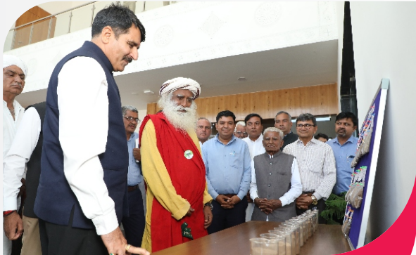
સેવ સોઈલ અભિયાન માટીના રક્ષણ માટેની પહેલ: માટી બચાવો

બનાસકાંઠા જિલ્લાને પ્રાકૃતિક જિલ્લો બનાવવાનો અને પ્રાકૃતિક ખેતી અપનાવવાનો બનાસવાસીઓએ સંકલ્પ કર્યો છે. આ પહેલનો હેતુ જમીનની ફળદ્રુપતા જાળવી રાખવી અને રાસાયણિક ખાતરનો ઉપયોગ બંધ કરવાનો છે. આ અભિયાન હેઠળ, માટી બચાવો અભિયાન શરૂ કરવામાં આવ્યું છે. આજના સમયમાં, બનાસ ડેરીની ટીમ ૪૦ ગામોમાં જમીનની ફળદ્રુપતા અને કાર્બનના પ્રમાણને વધારવા માટે સતત કાર્ય કરી રહી છે. આ પ્રયાસ દ્વારા, પ્રદેશમાં પ્રાકૃતિક ખેતીને પ્રોત્સાહન આપવામાં આવશે અને ધરતી સ્વચ્છ અને સ્વસ્થ રહે તે માટેનાં પગલાં લેવામાં આવશે.