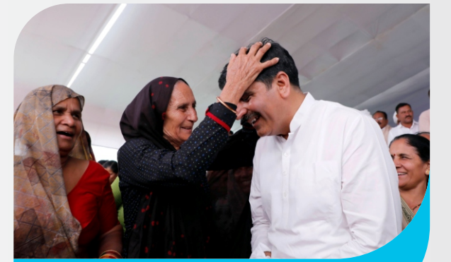
નારીશક્તિના આશીર્વાદથી પ્રેરિત વિકાસ

મહિલા પશુપાલક એ બનાસ ડેરીની શક્તિ, સન્માન, હર્ષ, ઉત્કર્ષ, તેમજ જિલ્લા અને દેશનું ગૌરવ છે. બનાસ ડેરી દ્વારા બનાસકાંઠા જિલ્લાના વિવિધ તાલુકાઓમાં દૂધ દિન અને મહિલા જાગૃતિ કાર્યક્રમોનું આયોજન કરીને, સંઘની પ્રગતિ, પશુપાલકોના સર્વાંગી વિકાસ, અને દૂધ સિવાયના અન્ય સાહસો અંગે મહિલા પશુપાલકોને માહિતી આપવાની સાથે, દૂધ ઉત્પાદનમાં શ્રેષ્ઠ કામગીરી કરતી મહિલાઓને સન્માનિત કરવામાં આવી છે. બનાસ ડેરીએ, મહિલાઓને, નાણાકીય સશક્તિકરણ માટે લાભકારક બનાવતાં, તેમને શક્તિ અને સક્ષમતા વધારવાની પ્રેરણા આપી છે. બનાસ ડેરી સાથે જોડાયેલ સશક્ત, સક્ષમ અને સ્વાવલંબી નારીશક્તિને સલામ!