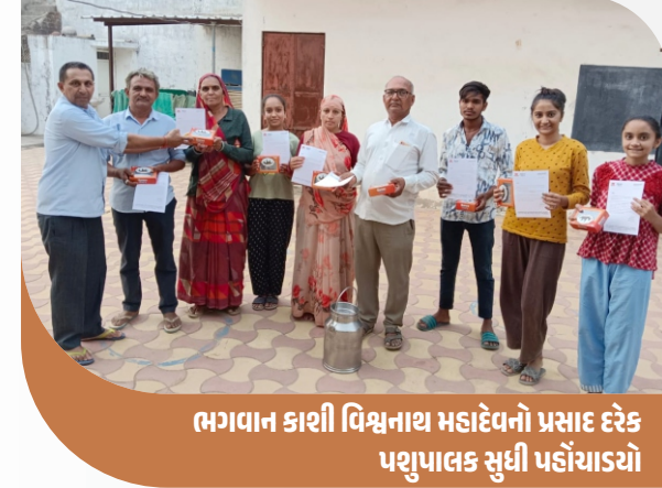
ભગવાન કાશી વિશ્વનાથ મહાદેવનો પ્રસાદ દરેક પશુપાલક સુધી પહોંચાડયો