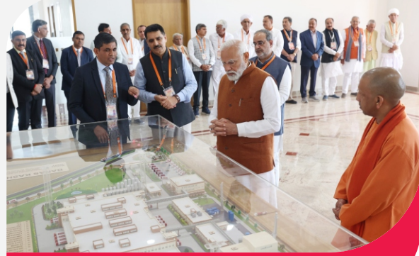
બનાસ હવે બનાસમાં

ચેરમેન શ્રી શંકરભાઈના મજબૂત ઈરાદા, અતૂટ વિશ્વાસ, અને દ્રઢ ઈચ્છાશક્તિ સાથે, બનાવવામાં આવેલા બનાસ કાશી સંકુલનું લોકાર્પણ યશસ્વી વડાપ્રધાન શ્રી નરેન્દ્રભાઈ મોદીએ ૨૩ ફેબ્રુઆરી ૨૦૨૪ ના રોજ કર્યું હતું. આ સંકુલને ૩૦ એકર જમીન પર અંદાજિત ૬૫૨ કરોડ રૂપિયાના ખર્ચે નિર્મિત કરવામાં આવ્યું છે. આ સંકુલ પૂર્વાચલના ખેડૂતો અને પશુપાલકોની આવક બમણી કરવાની સાથે સાથે તેમને બનાસ ડેરીના દૂધ, મીઠાઈ, આઈસ્ક્રીમ, પનીર, માવો, ઘી અને અન્ય દૂધની બનાવટોની સુવિધા ઉપલબ્ધ કરાવશે. બનાસ કાશી સંકુલ ઉત્તર પ્રદેશને સહકારી ક્ષેત્રમાં વિકાસ મોડલ તરીકે સ્થાપિત કરવાનું એક સીમાચિહ્ન છે. આથી, ગુજરાતની જેમ હવે ઉત્તર પ્રદેશમાં પણ શ્વેતક્રાંતિનો ઇતિહાસ રચાશે અને સહકાર માત્ર એક વ્યવસ્થા જ નહીં, પરંતુ મજબૂત વિચારધારા બની રહેશે. આ વ્યવસ્થા પ્રોત્સાહિત કરીને, ઉત્તર પ્રદેશમાં પશુપાલનના વ્યવસાયનું પ્રમાણ વધશે, જેનાથી પશુપાલકો અને ખેડૂતો સમૃદ્ધિ, સશક્તિ, અને આત્મનિર્ભરતા પ્રાપ્ત કરી શકશે.