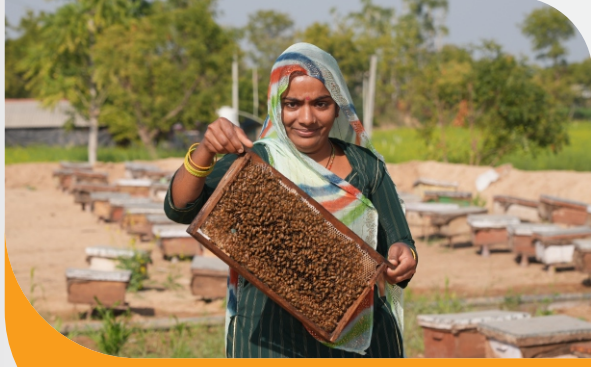
શ્વેતકાંતિ બાદ સ્વીટકાંતિ

બનાસકાંઠા જિલ્લાના ખેડૂતોએ બનાસ ડેરી સાથે જોડાઈને શ્વેતકાંતિમાં સફળતા પ્રાપ્ત કરી છે. વડાપ્રધાન શ્રી નરેન્દ્રભાઈ મોદીએ શ્વેતકાંતિ સાથે મધ ઉત્પાદન ક્ષેત્રે કાંતિ સર્જવાના લક્ષ્ય સાથે, બનાસ ડેરીએ અત્યાર સુધીમાં ૫૯૫ ખેડૂત પરિવારોને મધ ઉત્પાદન માટે તાલીમ આપી છે અને ૧૧,૮૩૭ મધ પેટીઓ વિતરિત કરી છે. આ પ્રયાસોના પરિણામે, જિલ્લામાંથી કુલ ૨૯૨.૦૨૩ મે.ટન મધનું સફળ રીતે સંપાદન થયું છે. મધના વાહક એવા જિલ્લાના ખેડૂતોને વિશ્વસનીય પરિશ્રમ, પ્રયાસ, અને પુરુષાર્થના પરિણામરૂપ, વર્ષ ૨૦૧૭-૧૭માં રૂ. ૨.૪૦ લાખ મળ્યા હતા, જે ૨૦૨૩-૨૪માં વધીને રૂ. ૪૯૩.૮૬ લાખ મળ્યા છે. આ વધારો સમૃદ્ધિની દિશાને સ્પષ્ટ રીતે દર્શાવે છે.