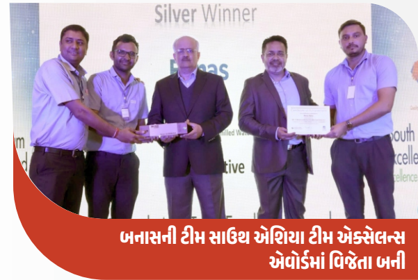
બનાસની ટીમ સાઉથ એશિયા ટીમ એક્સેલન્સ એવોર્ડમાં વિજેતા બની

૨૨ ડિસેમ્બર, ૨૦૨૩ ના રોજ દિલ્હી ખાતે American Society for Quality (ASQ) એવોર્ડ સ્પર્ધામાં બનાસ ડેરીની ત્રણ ટીમોએ ભાગ લીધો. અંતિમ રાઉન્ડ પ્રેઝન્ટેશન માટે, ભારતભરમાંથી ૪૦ થી વધુ ટીમો વચ્ચે થતી સ્પર્ધામાં બનાસ ડેરીની રેફ્રી-૨ અને TMR ટીમો ક્વોલિફાઇ થઈ ગઈ. આ ફાઇનલ ચરણોમાં, બનાસ ડેરીની રેફ્રી-૨ ટીમને સહકારી ક્ષેત્રમાં વિશિષ્ટ સિલ્વર એવોર્ડ મળ્યો, જ્યારે TMR ટીમે બ્રોન્ઝ એવોર્ડ જીત્યો. આ રીતે, બંને ટીમોએ સાઉથ એશિયા ટીમ એક્સેલન્સ એવોર્ડ પ્રાપ્ત કરીને સન્માન પ્રાપ્ત કર્યું.