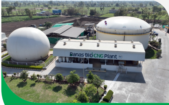
ગોબર થી ગોબરધન

બનાસ ડેરીના બનાસ જળશક્તિ અભિયાન હેઠળ, લોકભાગીદારી સાથે, બનાસના ગામડાઓમાં ૨૬૦ થી વધુ તળાવ ઊંડા અને મોટા બનાવવામાં આવ્યા છે. નવા તળાવો નિર્માણ કરીને ચોમાસાના પાણીનો સંગ્રહ કરવાની વ્યવસ્થા કરવામાં આવી છે. આ અભિયાનની મદદથી, સમગ્ર જિલ્લામાં ૧૫૦૦ થી ૩૦૦૦ કરોડ લીટર પાણીનો જળસંગ્રહ થયો છે, જેના કારણે કુવા અને બોરમાં ઊંડા જતા પાણીના સ્તર ઊંચા આવ્યા છે, પરિણામે પશુપાલન અને ખેતીમાં સિંચાઈ ક્ષેત્રે મહત્વપૂર્ણ લાભ મળ્યો છે.