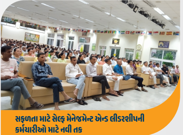
સફળતા માટે સેલ્ફ મેનેજમેન્ટ એન્ડ લીડરશીપની કર્મચારીઓ માટે નવી તક

આજની વ્યસ્ત જીવનશૈલીમાં, દરેક વ્યક્તિ પોતાનું જીવન સુખદ અને આરામદાયક બનાવવા માટે સતત પ્રયત્નશીલ છે. તેમણે તેમના આસપાસની દરેક બાબતને પોતાના નિયંત્રણમાં લેવાની કોશિશ કરી છે, પરંતુ બહુમતી લોકો હજુ પણ સાચા સુખ અને શાંતિનો અનુભવ કરવાને વંચિત છે. આ સ્થિતિને સમજતા, બનાસ ડેરીનાં કર્મચારીઓને બ્રહ્મહુમારી દ્વારા તૈયાર કરેલ સેલ્ફ મેનેજમેન્ટ એન્ડ લીડરશીપ કાર્યક્રમની તાલીમ આપવામાં આવી છે. આ કાર્યક્રમનું મુખ્ય લક્ષ્ય કર્મચારીઓને પોતાની જાતને નિયંત્રણમાં રાખવાની કળા શીખવવાનો અને તેમને જીવનમાં અનંત શાંતિ અને સુખનો અનુભવ કરાવવામાં મદદરૂપ થવાનો છે. આ તાલીમમાં ૧૫૦૦ થી વધુ કર્મચારીઓએ ભાગ લીધો છે, અને તેમણે આ અભ્યાસક્રમ દ્વારા મહત્વપૂર્ણ નેતૃત્વ અને આત્મ-નિયંત્રણના કૌશલ્યો પ્રાપ્ત કર્યા છે.