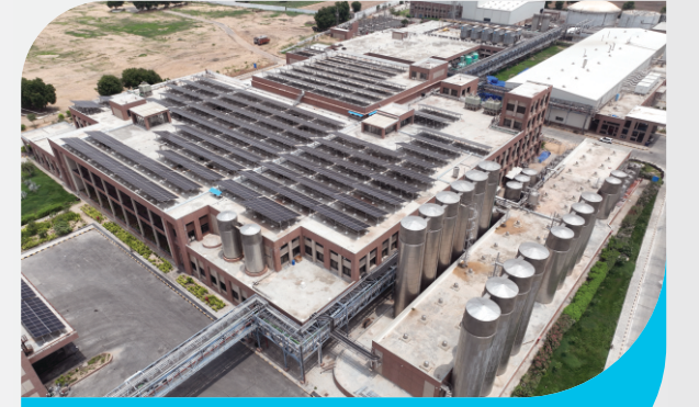
ઉર્જા આત્મનિર્ભરતા તરફ નવી શરૂઆત

આજે, બનાસ ડેરી દરેક મોરચે આગળ વધી રહી છે, અને હવે ઉર્જા ક્ષેત્રે પણ મહત્વપૂર્ણ પ્રયત્નો હાથ ધર્યા છે. ઉર્જા આત્મનિર્ભરતા ટકાવ વિકાસ માટેનો એક મહત્વપૂર્ણ ભાગ બની ગઈ છે. નવીનીકરણીય ઉર્જા અને ટકાવ ઉર્જાની કાર્યક્ષમતા પર ભાર મૂકવામાં આવી રહ્યો છે, અને પર્યાવરણની જાળવણી સાથે કાર્બન ન્યુટ્રલિટીનું મોટું ધ્યેય માનનીય પ્રધાનમંત્રીશ્રીના માર્ગદર્શન હેઠળ નક્કી કરવામાં આવ્યું છે. આ ઉદ્દેશને અનુરૂપ, વિવિધ પ્લાન્ટ્સના ધાબા પર સૌર ઉર્જા પ્રણાલી સ્થાપિત કરીને રૂ. ૧૬.૪૭ કરોડ જેટલી માતબર રકમની બચત કરી છે. આ પ્રયાસો ઉર્જા આત્મનિર્ભરતા તરફના પગલાંને મજબૂત બનાવે છે અને પર્યાવરણ માટે સકારાત્મક ફાળો આપે છે.