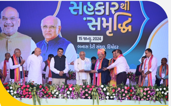
વિકાસલક્ષી પ્રકલ્પોનું ખાતમુહૂર્ત અને શુભારંભ

યશસ્વી વડાપ્રધાન શ્રી નરેન્દ્રભાઈ મોદીજીની "સહકારથી સમૃદ્ધિ" ની પરિકલ્પનાને સાકાર કરવા અને સહકારી ક્ષેત્ર તેમજ પશુપાલકોને સશક્ત, સક્ષમ અને સ્વાવલંબી બનાવવાના ઉદ્દેશ્ય સાથે મુખ્યમંત્રી શ્રી ભૂપેન્દ્રભાઈ પટેલજીના શુભહસ્તે બનાસ ડેરી દ્વારા ભીલડી ખાતે નિર્મિત થનાર બનાસ બોવાઈન બ્રીડિંગ એન્ડ રીસર્ચ સેન્ટર (B B B R C) અને પાલનપુર ખાતે નિર્માણ પામનાર બનાસ બેંક નવીન ઓડિટોરિયમ હોલ અને ખેડૂત ટ્રેનીંગ સેન્ટરનું ઇ- ખાતમુહૂર્ત તેમજ બાદરપુરા ઓઈલ સંકુલ ખાતે નિર્મિત થનાર બનાસ ડેરી અલ્ટ્રા મોર્ડન આટા પ્લાન્ટ અને બનાસ વ્હે પ્રોટીન અલ્ટ્રા ફિલ્ટરેશન પ્લાન્ટ, પાલનપુરનું લોકાર્પણ તથા બનાસ ડેરીના સંજીવની ખાતર પ્રોડક્ટ, બનાસ ઓર્ગેનિક ખાતર પ્રયોગશાળા અને અમૂલ ઓર્ગેનિક પ્રોડક્ટ, માર્ફકો ATM અને કિસાન ક્રેડિટ કાર્ડ તેમજ ઘી.ગુજરાત સ્ટેટ કો.ઓપ.બેંક.લી.ના બનાસકાંઠા અને પંચમહાલ જિલ્લાના પાયલોટ પ્રોજેક્ટનો શુભારંભ કરાયો.