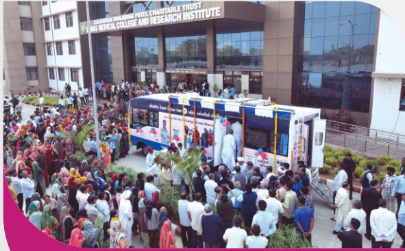
મહિલા પશુપાલકો માટે આરોગ્ય સુવિધાઓ મહત્વપૂર્ણ પહેલની શરૂઆત

પશુપાલનના વ્યવસાયને વેગ આપવા માટે, બનાસ ડેરી દર વર્ષે વરદુધાળા પશુ યોજના અંતર્ગત પશુપાલન સંબંધિત સહાય પૂરી પાડે છે. ચાલુ વર્ષે, કુલ ૪૦૨ લાભાર્થીઓને લાભ આપવામાં આવ્યો છે. વર્ષ ૨૦૨૩-૨૪ માં, આ ૪૦૨ લાભાર્થીઓને શેડ સહાય, વીમા પ્રીમીયમ સહાય, અને અન્ય ઘટકો જેમ કે મિલકીંગ મશીન, ચાફ કટર, અને ફોગર માટે ૭.૬૩ કરોડ રૂપિયાની સહાય આપવામાં આવી છે. આ સહાય સાથે, બનાસ ડેરી પશુપાલકોને સશક્તિ અને તેઓના વ્યવસાયને વધુ અસરકારક બનાવવા માટેની સર્વાર્થ દ્રષ્ટિ આપતી રહી છે.