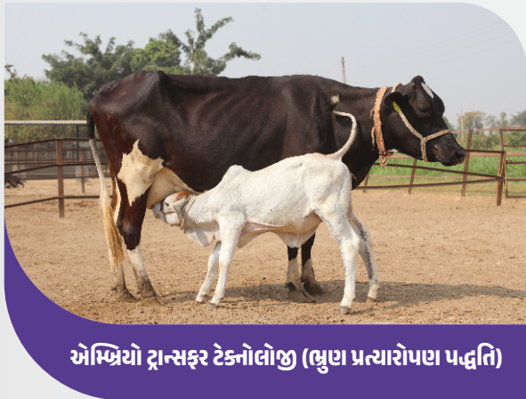
એમ્બ્રિયો ટ્રાન્સફર ટેકનોલોજી (ભ્રુણ પ્રત્યારોપણ પદ્ધતિ)

બનાસ ડેરીએ પાલનપુર ખાતે પોતાનો આધુનિક ૨૦ MTPD પનીર ઉત્પાદન પ્લાન્ટ સ્થાપિત કર્યો છે, જે સંપૂર્ણ રીતે ઓટોમેટિક છે. આ પનીર પ્લાન્ટમાં મોટા ભાગના સાધનો ભારતના છે, અને માત્ર થોડા સાધનોની આયાત કરવામાં આવી છે. આ પનીર પ્લાન્ટ 'મેક ઈન ઈન્ડિયા' કોન્સેપ્ટ અંતર્ગત બનાવવામાં આવ્યો છે. બનાસ ડેરી માટે, આ માત્ર એક સંપૂર્ણ ઓટોમેટિક પનીર ઉત્પાદનનો પ્રોજેક્ટ નથી, પરંતુ પરંપરાગત પદ્ધતિથી તૈયાર થતા પનીર ઉત્પાદન પ્રક્રિયા પરથી ઓટોમેટિક પનીર ઉત્પાદન પ્રક્રિયા તરફની યાત્રા છે, જે ભારતીય ડેરી ઉદ્યોગની પ્રશંસનીય સિદ્ધિ છે.