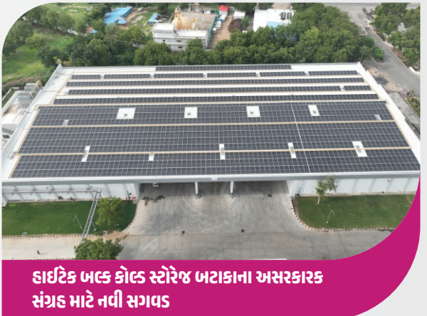
દાઈટેક બલ્ક કોલ્ડ સ્ટોરેજ બટાકાના અસરકારક સંગ્રહ માટે નવી સગવડ

બનાસ ડેરીએ બટાકાની ખેતી અને ઉત્પાદનને મજબૂત બનાવવા માટે નવા પ્રોજેક્ટો શરૂ કર્યા છે. આ પ્રોજેક્ટની એક મહત્વપૂર્ણ બાબત તરીકે, બનાસ સંકુલ, સણાદર ખાતે પોટેટો પ્લાન્ટ સ્થાપિત કરવામાં આવ્યો છે, જે બટાકાની વિવિધ વાનગીઓનું ઉત્પાદન કરે છે. આ પ્લાન્ટ માટે જરૂરી બટાકાનો સંગ્રહ કરવા બાદરપુરા ખાતે અદ્યતન બલ્ક કોલ્ડ સ્ટોરેજનું નિર્માણ કરવામાં આવ્યું છે. આ કોલ્ડ સ્ટોરેજ ફેબ્રુઆરી ૨૦૨૪ માં કાર્યરત થયો છે, જેમાં ૧૦,૦૦૦ મેટ્રિક ટન બટાકા સંગ્રહ કરવાની ક્ષમતા છે. આ કોલ્ડ સ્ટોરેજમાં બટાકાની ગુણવત્તા જળવાઈ રહે છે અને લાંબા સમય સુધી બટાકામાં મીઠાશનું સ્તર જળવાઈ રહે છે. પ્રાઈવેટ કોલ્ડ સ્ટોરેજની તુલનામાં, આ કોલ્ડ સ્ટોરેજમાં ગ્રેડિંગ અનુસાર બટાકાનો સંગ્રહ કરવામાં આવે છે, અને ગ્રેડિંગ પછી બટાકા સરળતાથી ખાલી કરવામાં આવે છે. વિશિષ્ટ રીતે, આ કોલ્ડ સ્ટોરેજ વિવિધ જાતના બટાકા માટે વિશેષ સુવિધા આપે છે. બનાસ ડેરી દ્વારા શરૂ કરાયેલ આ કોલ્ડ સ્ટોરેજને લીધે સંઘના કરોડો રૂપિયાની બચત થવાની આશા છે, જે સંગ્રહ અને ઉત્પાદન પ્રક્રિયાઓમાં સુધારાઓ લાવશે.