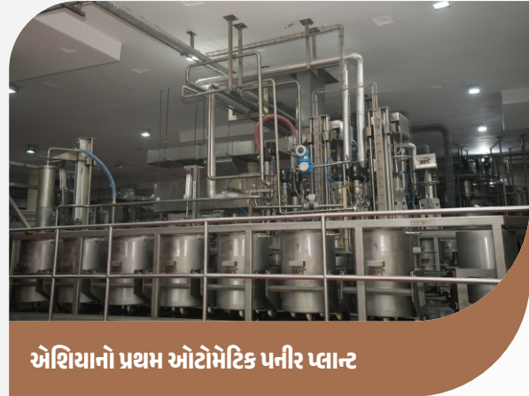
એશિયાનો પ્રથમ ઓટોમેટિક પનીર પ્લાન્ટ