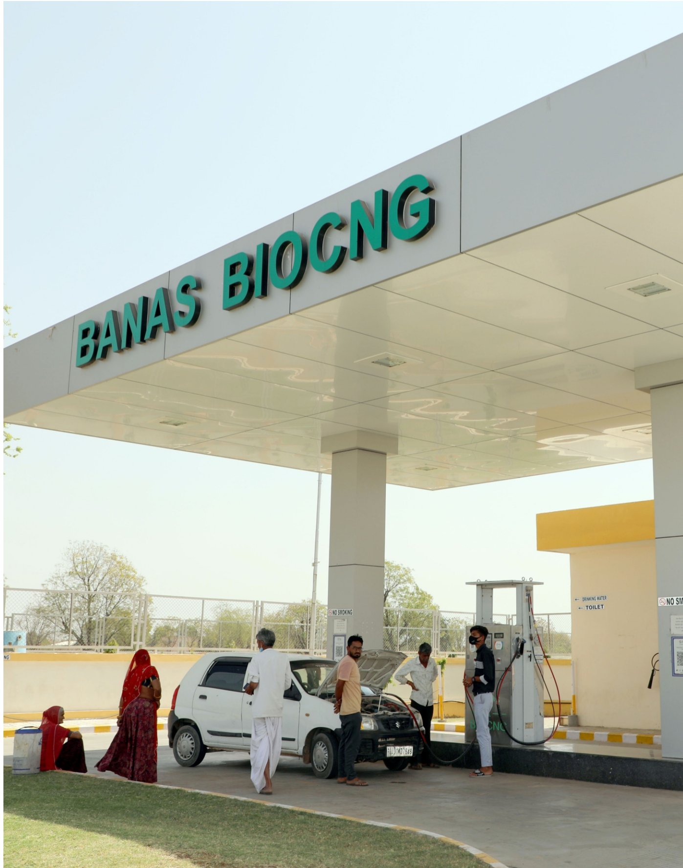
Design By : Banas Dairy Media