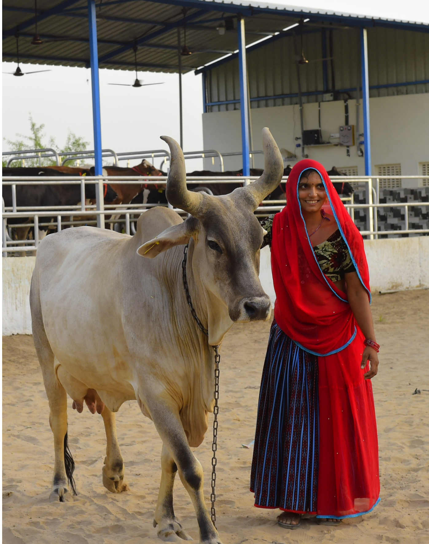
Design By : Banas Dairy Media